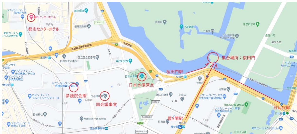
[見取り図]※google map より編集