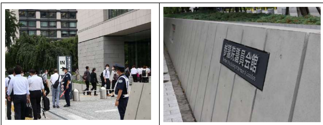
昼食と研修の会場となる参議院会館へ到着！