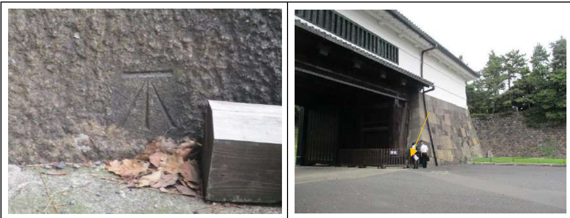
几号水準点(桜田門) 移動開始!