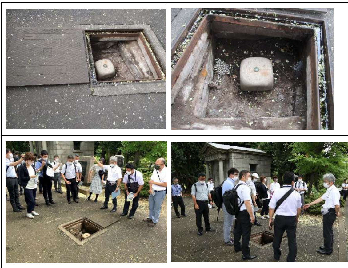
日本水準原点から結びつける同一敷地内(目の前)にある一等水準点乙