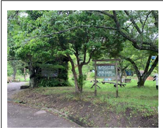
画像にはありませんが、女性モデルとプロのカメラマンが撮影中でした