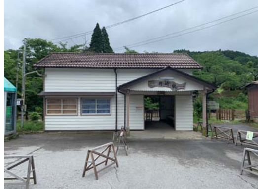
月崎駅（路線の中では整備されている）