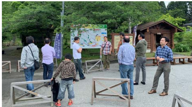
駅前に集まる調査士