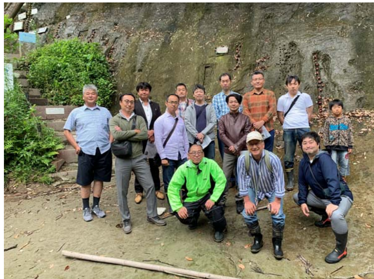
チバニアンの前で決意を新たにした集団

梅雨の時期なので天気が危ぶまれましたが、雨に降られずに済みました。前の審査ではイタリアを大差で破ったものの、まだ審査があり、最終的には国の補助を受けたイタリアに敗れるのではないかと危惧していました。養老溪谷の温泉も近くにあるので、千葉の発展に繋がって欲しいですね