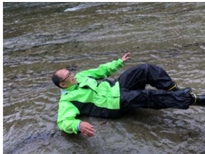
雄大な景色におののいている図